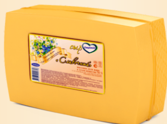
Сыр «Сливочный» 50% (срок созревания 25 суток)