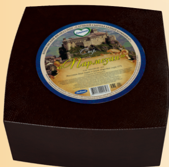
Сыр «Пармезан» 45% (срок созревания 12 месяцев)