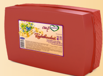
Сыр «Буковинский» 45% (срок созревания 30 суток)