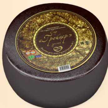
Сыр «Гройцер зрелый» 50% (срок созревания 120 суток)