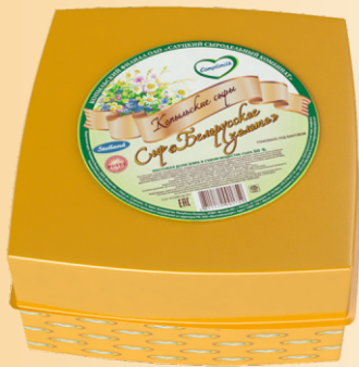
Сыр «Белорусское золото» 50% (срок созревания 15 суток)