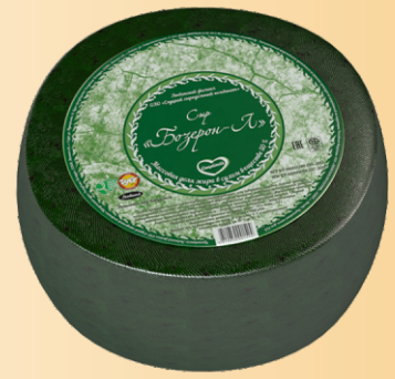
Сыр «Бозерон-Л» 50% (срок созревания 60 суток)