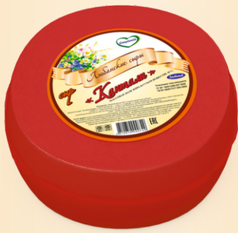
Сыр «Кантали» 30% (срок созревания 30 суток)