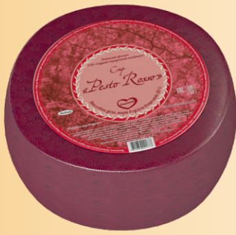
Сыр «Pesto Rosso» 50% (срок созревания 60 суток)