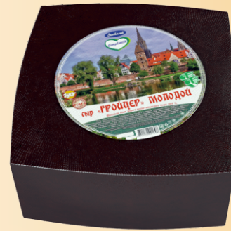
Сыр «Гройцер молодой» 50% (срок созревания 90 суток)