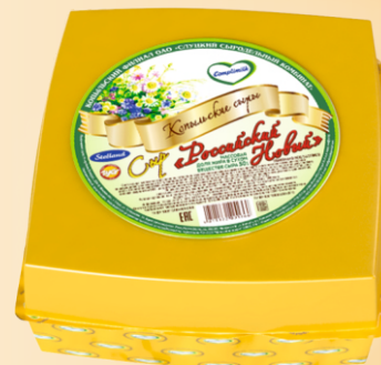
Сыр «Российский Новый» 50% (срок созревания 45 суток)