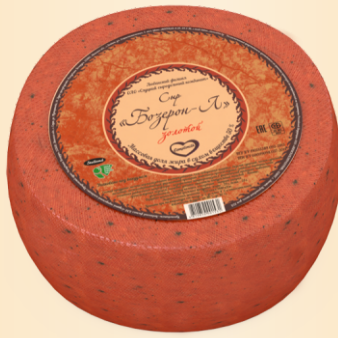
Сыр «Бозерон-Л» золотой 50% (срок созревания 60 суток)