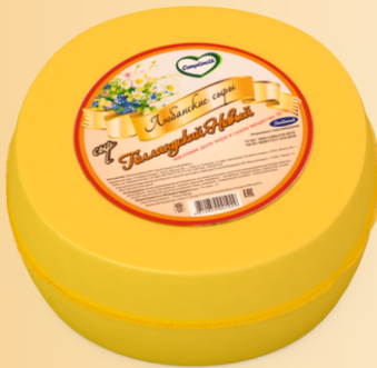
Сыр «Голландский Новый» 30% (срок созревания 30 суток)