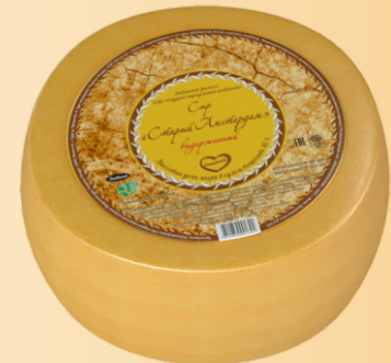
Сыр «Старый Амстердам» 45% (срок созревания 90 суток)