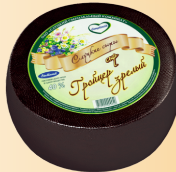
Сыр «Гройцер зрелый» 40% (срок созревания 120 суток)