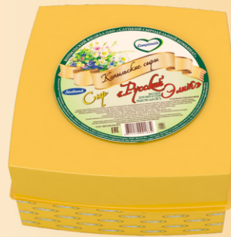
Сыр «Русский Элит» 50% (срок созревания 25 суток)