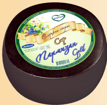
Сыр «Пармизан Gold» 45% (срок созревания 90 суток)