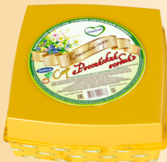
Сыр «Российский особый» 50% (срок созревания 15 суток)