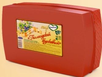
Сыр «Голландский брусковый» 45% (срок созревания 45 суток)