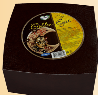
Сыр «Golden eyes» 45% (срок созревания 45 суток)